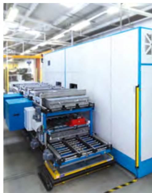
photo 1 LIMPIO avec deux chambres de travail