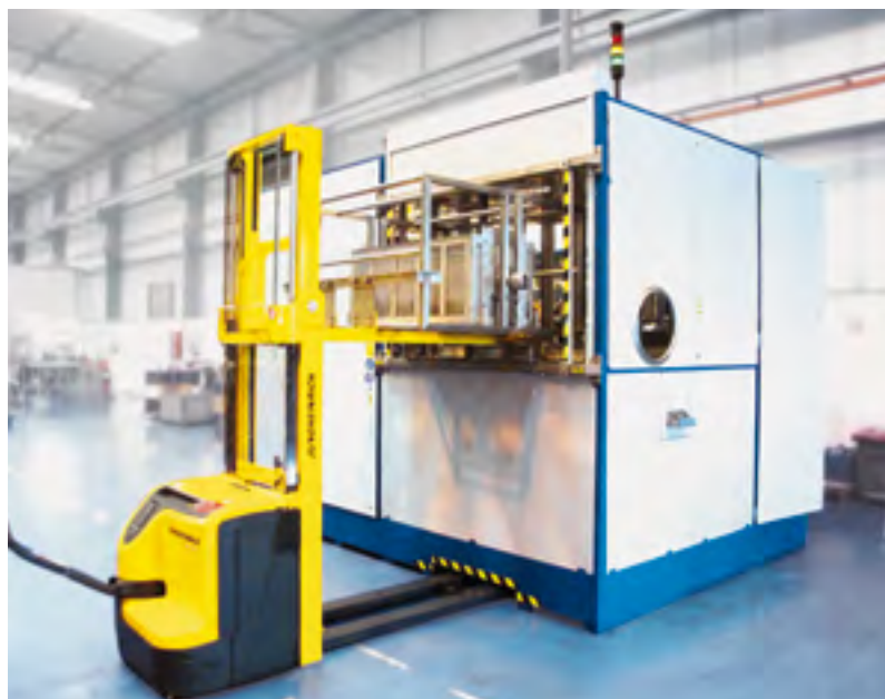
photo 3 GIGANT FRONT-TOP-LOADER chargée manuellement