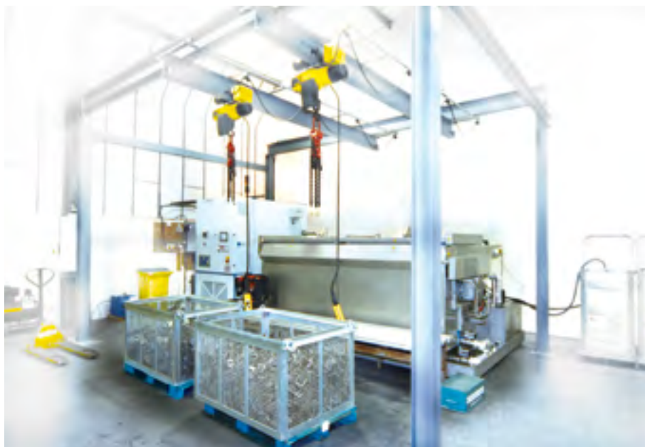
photo 2 GIGANTTOP-LOADER avec double portique