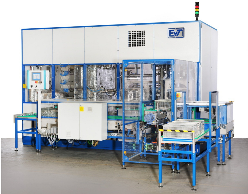
Installation type LIMPIO

Actuellement, l'installation est en utilisation sur 2 équipes, mais au besoin elle pourra évoluer vers un mode de 3 équipes. Une bonne installation n'est la solution idéale pour le client qu'en utilisant le bon solvant. Dans ce cas, ce fut le Perchloréthylène, pour d'autres applications et besoins les produits spécifiés aux données techniques sont disponibles.